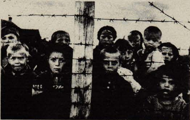
Kızıldordu'nun 1944'de toplama kamplarından kurtardığı çocuklar.