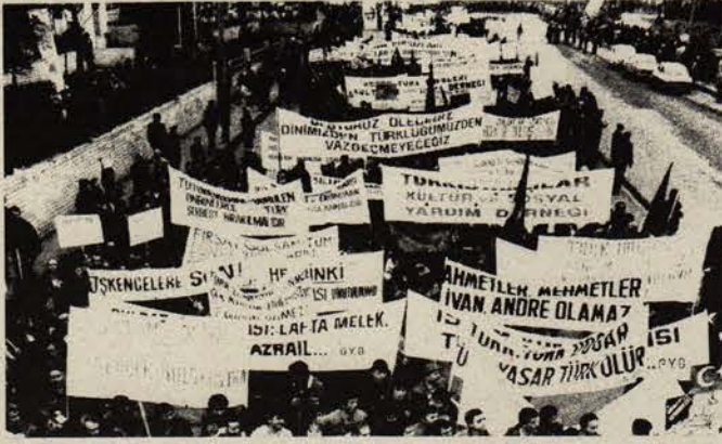
Türk milliyetçiliğinin azgınca şartlandırmasına maruz kalan kitleler.

B İR başka sovenist tekerleme de budur. Oysa dünyanın dört bir köşesinde bizim gibi işçiler vardır, emek-