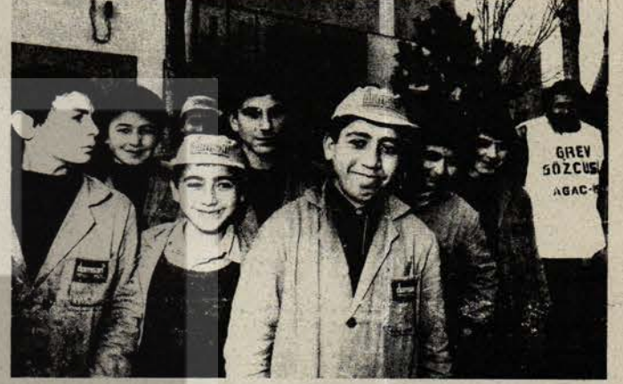
Yasal olarak grev yapamayan çıraklar çalışırken grev gözcüsü sadece seyrediyor.

4 Mayıs'ta Hamourg'da, Hamburger Strasse'de, saat: 11'de, yine 4 Mayıs'ta Köln'de, saat: 11'de Ebertplatz'da, aynı tarihte Frankfurt'ta Kaiser-Siegmund-Strasse'deki Hauptfriedhof'ta Alman Komünist Partisi ve diğer kuruluşlar tarafından gerçekleştirilecek 8 Mayıs Faşizmden Kurtuluş Günü gösterilerine katılalım!