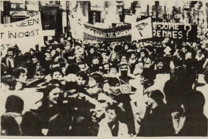
Binlerce Brükselli füzeleri protesto etti.