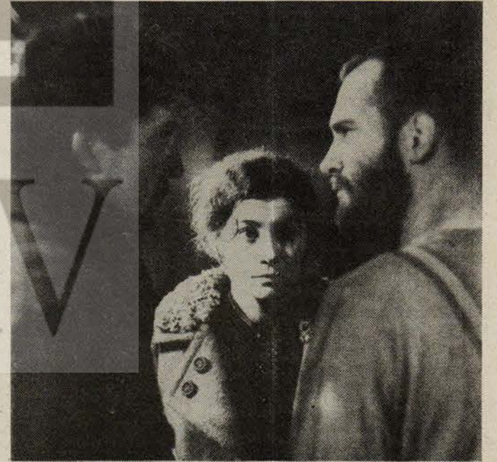
Demokratik Alman filmi "Kadın ve Yabancı"

Filmin belirleyici niteliğinin savaş aleyhtarlığı olmasına rağmen, savaş filmde doğrudan gösterilmiyor. Ana tema olarak savaşın insanlar ve aralarındaki ilişkiler üzerindeki etkileri işleniyor. Yönet-