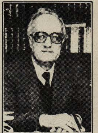
Christos Sartzetakis Yunanistan C. Başkanı oldu

Sosyal demokrat PASOK Partisi ve Yunanistan Komünist Partisi'nin desteklediği 56 yaşındaki hâkim Christos Sartzetakis 29 Mart günü yapılan üçüncü tur oylamada yeterli 180 oyu alarak Cumhurbaşkanı seçildi. Bilindiği gibi eski cumhurbaşkanı Karamanlis, PASOK'un kendisini desteklemeyeceğini bildirmesi üzerine istifa etmiş ve bunun üzerine cumhurbaşkanlığı için seçimlere gidilmişti. Yunanistan yasaları (Devamı 9. sayfada)