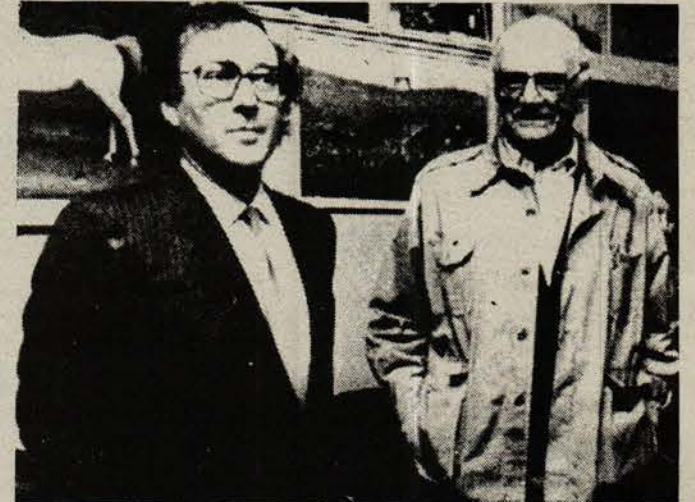
Barış-2 davasını izlemek amacıyla Türkiye'ye giden ünlü İngiliz Tiyatro yazarı Harold Pinter ile ABD'li tiyatro yazarı Arthur Miller.

Miller basın toplantısında, "Türkiye gezisi, görüşmeler ve incelemeler benim için çok üzücü, çok yorucu, aynı zamanda çok sevindirici oldu" diyerek son verdi.