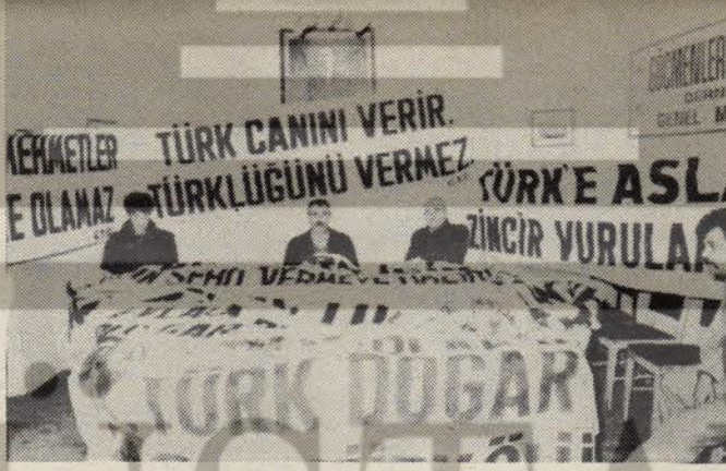
Sovenizmin çalışma alanlarından biri: Göçmenler Derneği

emperyalistler Yunan ordularını Türkiye'ye saldırtılar. Böylece, Türkler, Kürtler, Çerkesler, diğer milliyetlerden olan Anadolu halkı birleşip ulusal kurtuluş savaşı verdi. Yunanlıların ardındaki esas düşman İngilizlerdi. Savaş sonrası kurulan Türk devleti, kapitalist bir devlettir. Batıyla, yani emperyalistlerle iyi geçinip onların kuyruğuna takılmak istedi. Bu yüzden Batı aleyhtarlığı işine gelmediği için kurtuluş savaşını sanki sadece Yunanlılara karşı yapılmış gibi gösterdi ve Yunan düşmanlığını körükledi. Böylece halkın Batılı büyük devletlere, İngilizlere, Fransızlara, Amerikalılara olan tepkisini şaşırtıp Yunanlılara karşı kaydırmak istedi. İşte Yunanlılara karşı küfürler bunun için sürekli beslenip sürdürüldü.