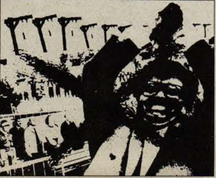
SOL BİRLİK LINKE EINHEIT

Nein zur faschistischen Diktatur und ihrem Ministerpräsidenten ÖZAL