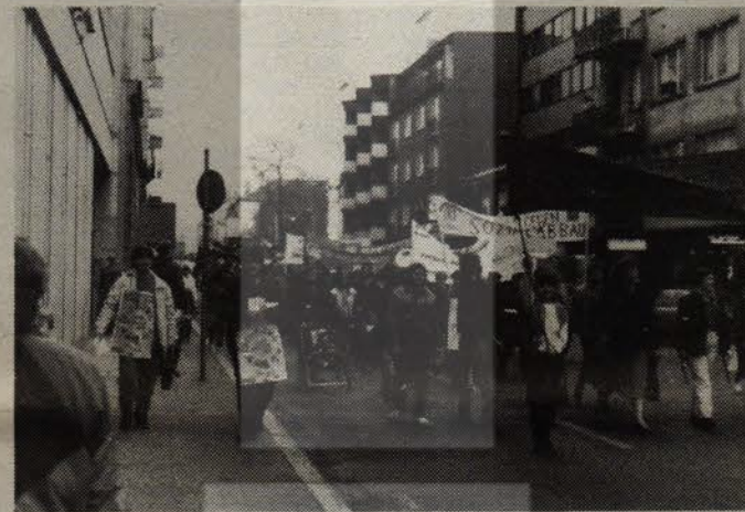
8 MART YÜRÜYÜŞÜNE KATILAN KADINLAR

Münih Göçmen İşçiler Çalışma Grubu'nun başlattığı "Bir Gün-Bir Dolar" emeklilik yasa tasarısına karşı kampanyanın çeşitli dökümanlarını izleyicilere dağıtıldığı seminer çeşitli konularda sorulara verilen cevaplarla bitirildi.