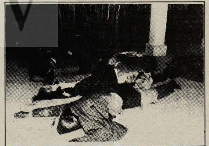
İsrail işgal kuvvetlerinin korkunç katliamından bir sahne. Yukarıdaki resim Humin'de öldürülen 7 Lübnan'ının cesedini gösteriyor.

İşte Batı'daki F.Almanya henüz bu olgunluğa varamadığından (kısa sürede de varacağı benzemiyor) Auschwitz yasasını çıkarırken ipin ucunu kaçırıyor. "Ben demokratım" diyemediği için "başkaları anti-demokrat, ben anti-demokrat değilim" der gibi lâf ebeliğine düşüyor. "Halkların kardeşliğinden yanayım" diyemediği için antikomünizme yöneliyor.